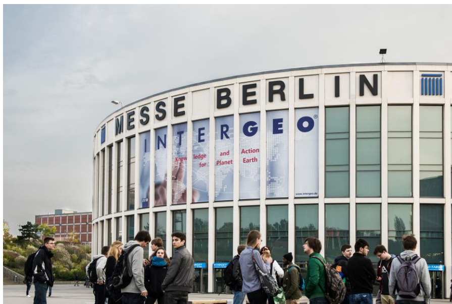
Messe Berlin während der INTERGEO 2014

Die in diesem Bericht aufgeführten Informationen wurden durch Interviews der Autoren mit den vor Ort vertretenen Ausstellern und Experten gewonnen. Dabei wurde besonders großer Wert darauf gelegt, sowohl aktuelle Neuentwicklungen als auch Zukunftsszenarien der Branche herauszustellen. Die resultierenden Ergebnisse werden im Folgenden strukturiert nach den einzelnen Themen dargestellt.